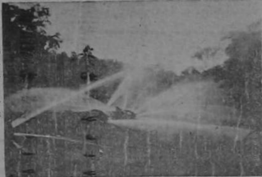
Pésimo estado en que se encuentra la tubería de la planta eléctrica de Siquirres

Instalación de la nueva Municipalidad el domingo pasado